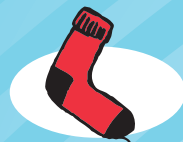
ARTILEZKO GALTZERDIA urte 1