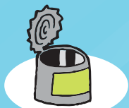
KONTSERBA-POTEA 10-100 urte