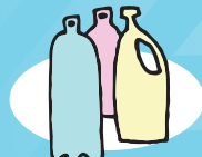
PLASTIKOZKO BOTILA 100-1.000 urte