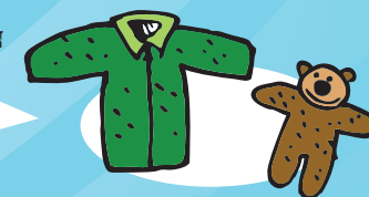
JANTZI POLARRAK / JERTSE PELUXEAK